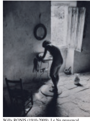
Willy RONIS (1910-2009), Le Nu provençal, Gordes, 1949

« Photographies » Vente : jeudi 28 avril, à 14h30 Retransmission sur Drouot Online et LiveAuctioneers